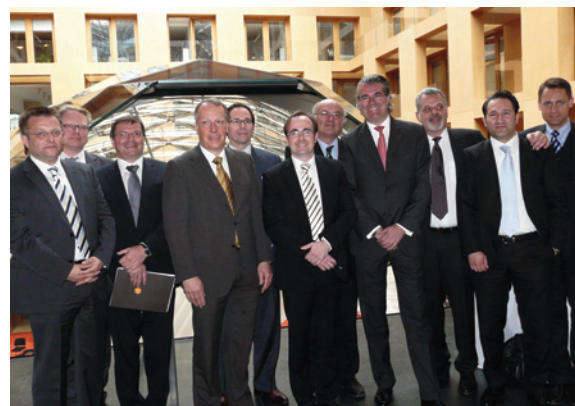
„eHealth – Gesundheit braucht Service“: Unter diesem Motto bietet Asklepios dem Patienten verstärkt elektronische Dienstleistungen an, um Qualität, Transparenz und Bindung an das Klinikum zu verbessern. Mit Partnern präsentierte die Klinikgruppe im conhIT-Kontext aktuelle B2C-Lösungen.